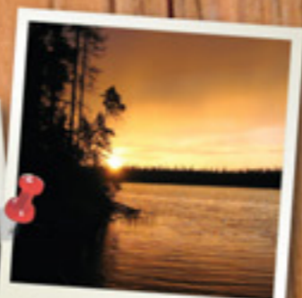
REPLI DE BAIES