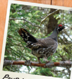
POUR LES CHASSEURS DE PETITS OIBIERS...