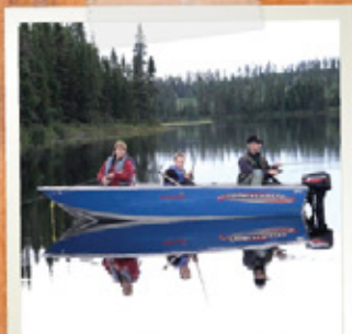
CHALOUPÉ PRINCECRAFT 14' Moteur MERCURY 15 HP