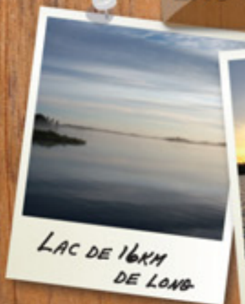
LAC DE 16KM DE LONG