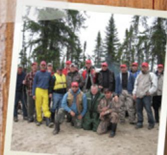
15 PERSONNES OU PLUS... OBTENEZ L'EXCLUSIVITÉ DE LA POURVOIRIE