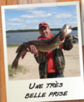
UNE TRÈS BELLE PRISE