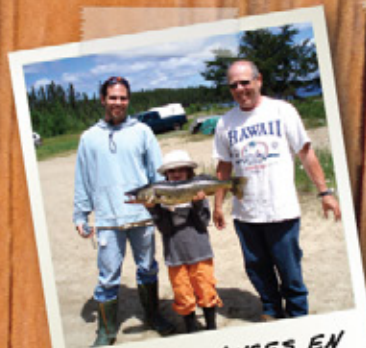
DES VACANCES EN FAMILLE