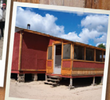
CHALET DE 8 PERSONNES