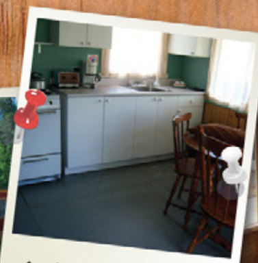
INTÉRIEUR D'UN CHALET