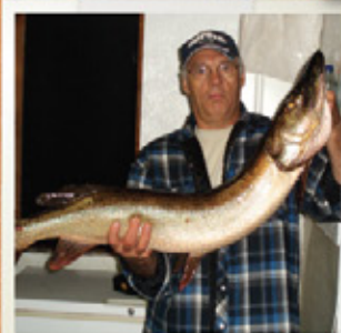
UN BEAU SPÉCIMEN