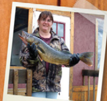
TOUT UN TROPHÉ!!!