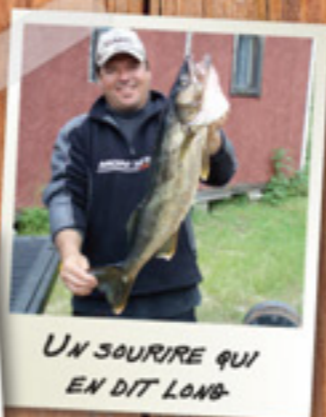
UN SOURIRE QUI EN DIT LONG