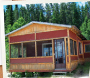
CHALET DE 4 PERSONNES