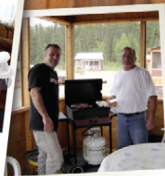
INTÉRIEUR D'UNE VERANDA